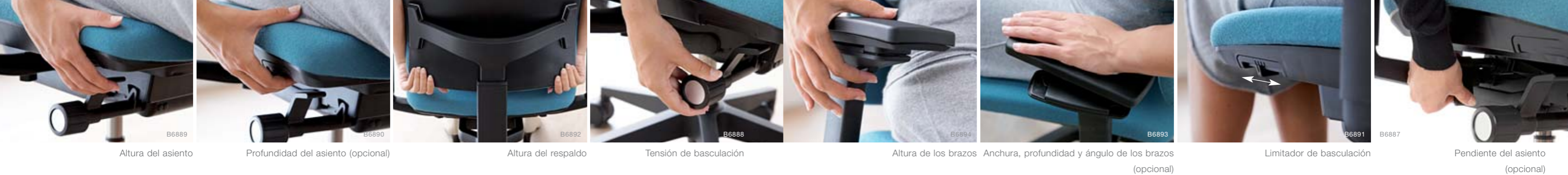
B6889 Altura del asiento