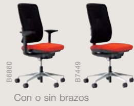
Con o sin brazos